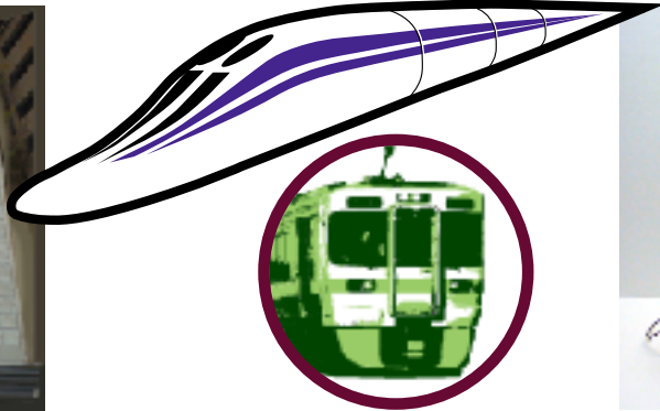
飯田線とリニア中央新幹線が交差する未来