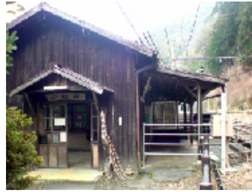
秘境駅へ、行ってみた。(小和田駅)