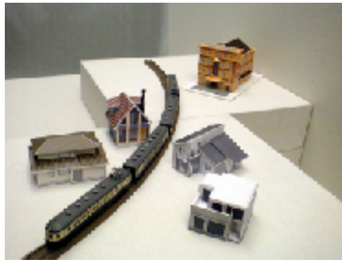
伊那まちつくろう！Nゲージ鉄道ジオラマ